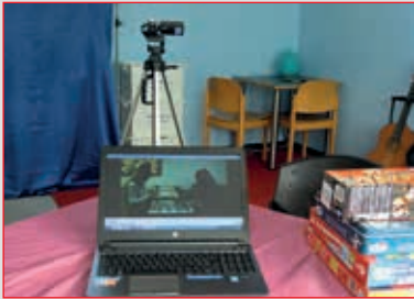
Videogestützte Beratung nach Marte Meo